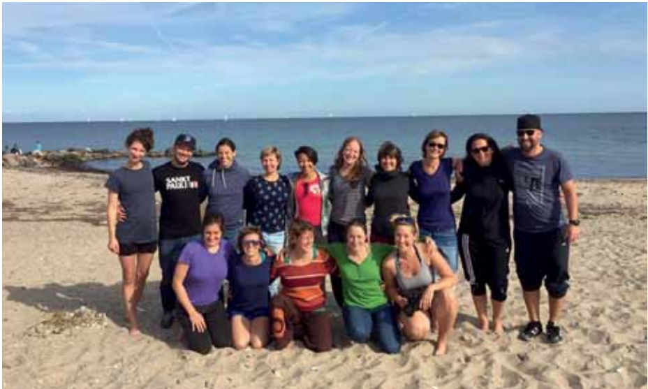
Foto: Gruppenbild Trainingslager