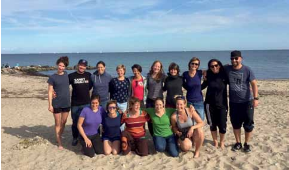
Foto: Gruppenbild Trainingslager

mit großem Kader und vielen Premieren in die neue Saison gestartet.